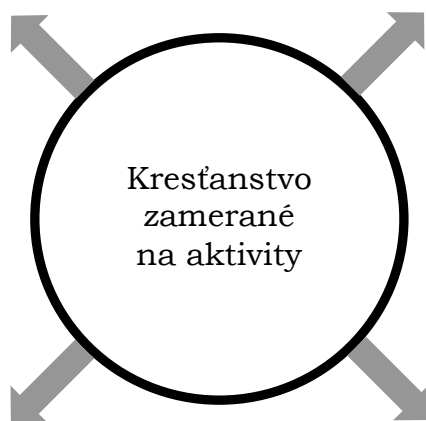
Obrázok č. 3 Evanjelizujúce zbory

Bez ohľadu na to, kam na svete som šiel, zistil som, že veriaci sa všade môžu stotožniť