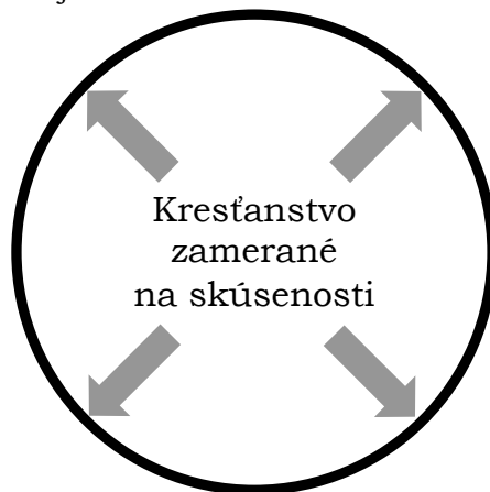
Obrázok č. 2 Zbory pestujúce vzťahy

Tieto zbory sú často označované ako zbory „získavajúce duše.“ Ich hlavná silná stránka spočíva v ich vášni pre získavanie ľudí pre Krista prostredníctvom verejného kázania