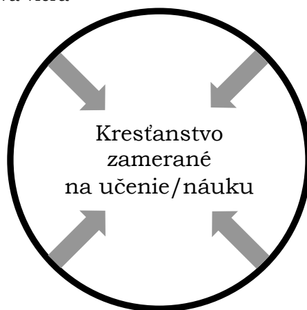
Obrázok č. 1 Zbory vyučujúce Bibliu

Hoci pripúšťam, že nasledujúce pozorovania sú veľmi zjednodušené a niekedy zveličené, pomôžu nám zhodnotiť, aké štruktúry sme v našich vlastných zboroch vytvorili, aby sme dali dôraz určitú nevyhnutnú činnosť alebo prvok.